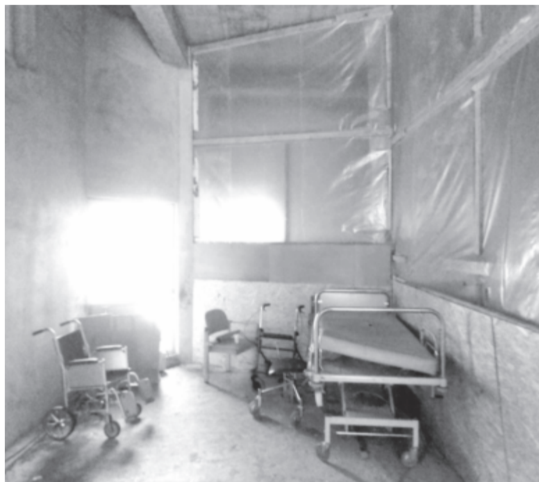
Nejlonból a falak és az ablak