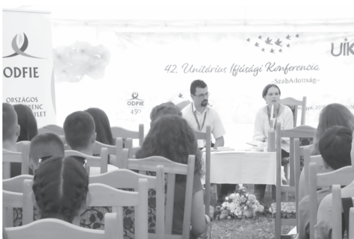
Számos, a fiatalok gondolkodását is meghatározó kérdést vetettek fel a konferencián

Az unitárius ifjúsági konferenciák kezdete a múlt század első felére nyúlik vissza, 1928–1947 kö-