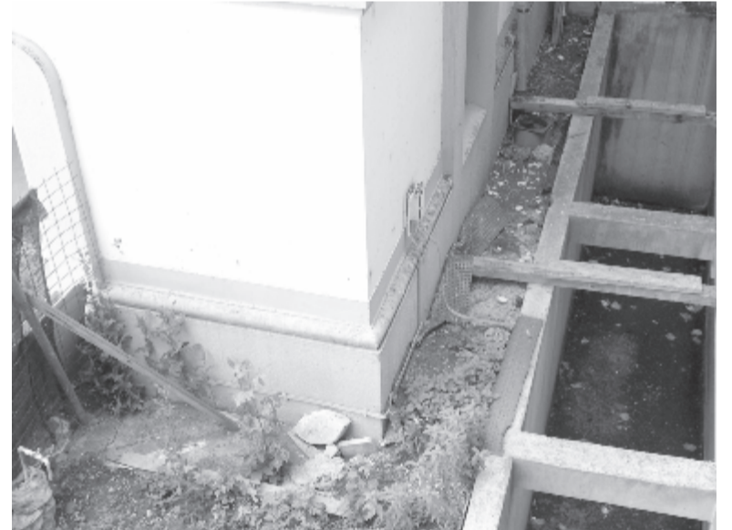
Gondok az alagsorral

– Mind az idén, mind a múlt évben, és azelőtt is utaltunk ki pénzt javításra, de a kórház összes épületét, amelyek közül némelyik több mint százéves, nehéz kifogástalan állapotban fenntartani, ezért sorra vesszük mindeniket. Az endokrinológiai klinikán jelenleg is dolgoz-