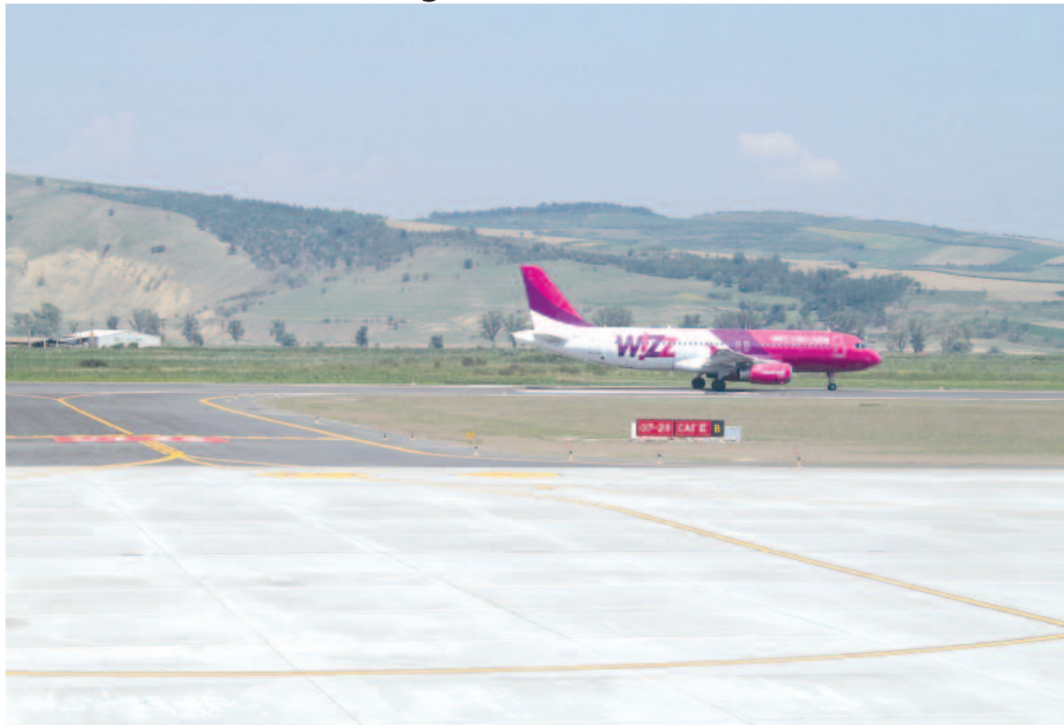
A repülőtér kifutópályájának felújítása volt az egyik legfontosabb beruházás