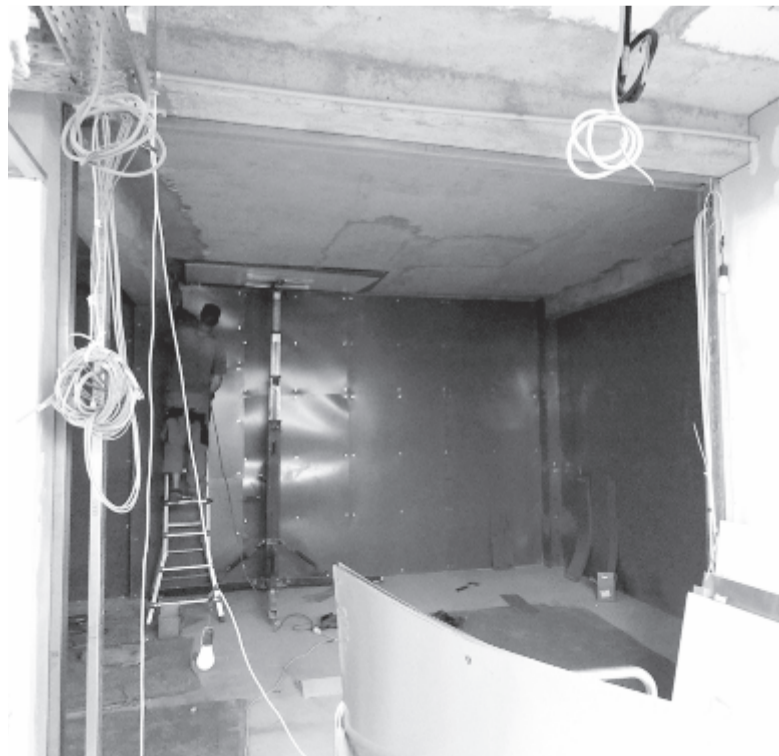
Készül a helyiség az MR-nek

– A kórházbővítési munkálatokat a finanszírozás hiánya miatt hagyták abba, és időközben lejárt az építkezési engedély érvényessége is. Jelenleg le kell zárni, és át kell venni az eddig elvégzett munkát. Következik egy felmérés arról, hogy az eredeti tervből mi valósult meg, majd be kell fejezni az építkezést, mivel szükségünk van az épültre. – Amikor a bővítési munkákról adtunk hírt, arról volt szó, hogy az urológiai klinika és a plasztikai sebészet új műtőt kap, az utóbbi pedig kórtermeket is.